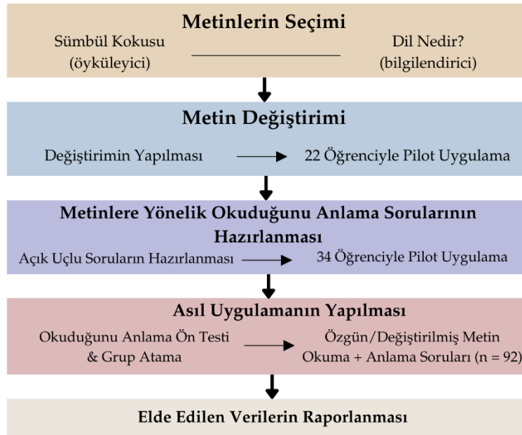
Şekil 1. Araştırma Tasarımı